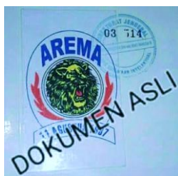
Gambar 4. Logo Resmi Arema dalam dokumen resmi