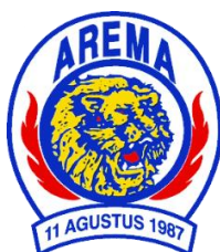
Gambar 2. Logo Resmi Arema Malang